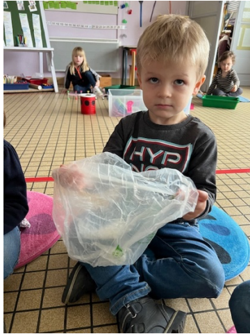
Un sac plastique