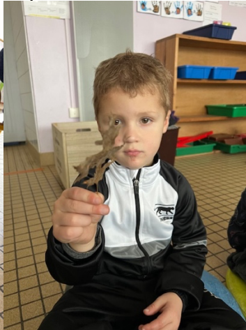
une feuille d'arbre