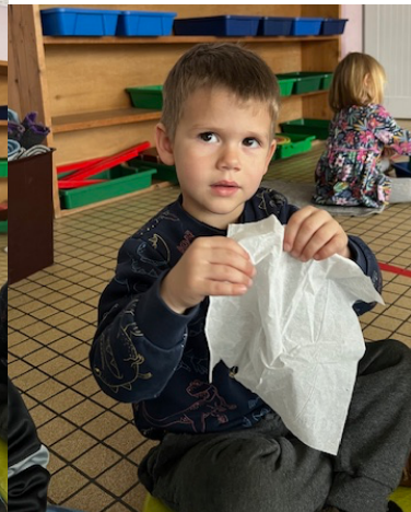
un mouchoir en papier