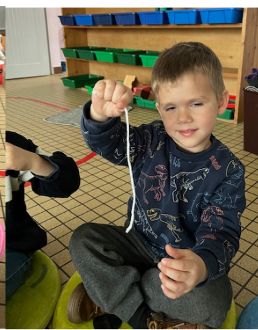
un morceau de laine