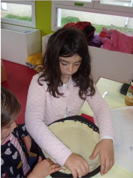
.....mis la pâte dans le moule,