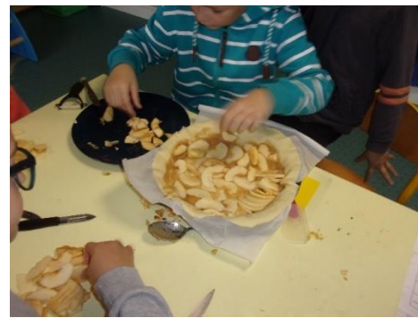
.....disposé les pommes