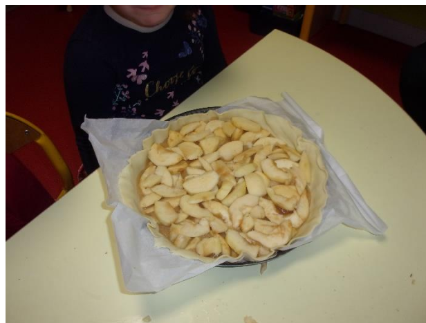
Et voilà, il n'y a plus qu'à la mettre à cuire !

Un grand merci aux mamans et mamie qui nous ont aidés !