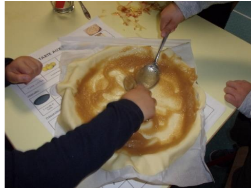
.....étalé la compote,