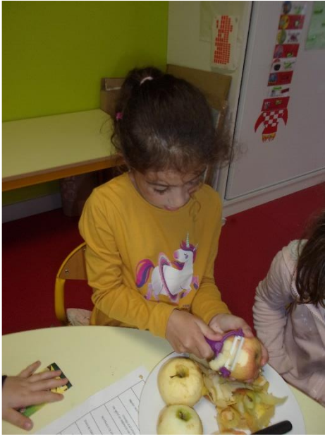
Nous avons épluché...